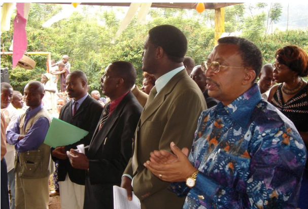
Das Weihnachtsfest 2005 wird mit dem Gouverneur vom Süd-Kivu, dem Chefarzt des Spitals und dem Vizebürgermeister gefeiert.

Dafür wurden Kleider (Pagnes) für alle Frauen gekauft, und die Kinder erhielten kleine Geschenke. Das war ein unvergessliches Fest für uns alle – mit wenig Aufwand und viel Freude. Dank der Hilfe des Vereins HKK erinnern sich diese leidenden Menschen mit Freude an Weihnacht. Für viele war es seit Jahren das erste Weihnachtsfest ohne Angst, Bedrohung und Flucht.