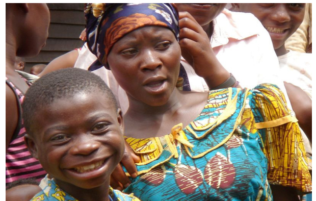
Der verschmutzte Knabe blieb während 8 Monaten an der Seite seiner vergewaltigten Mutter im Spital. Die Weihnachtsfeier gibt ihnen Hoffnung und Optimismus auf eine bessere Zukunft