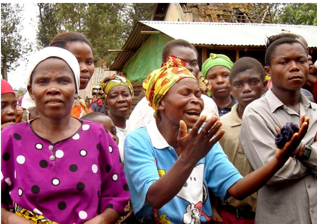
Die Mütter bezeugen ihren Dank mit Gesang und Gebet.